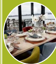
Splav Viva – druženje