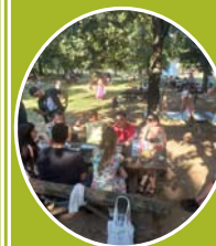
Ada – druženje i roštilj