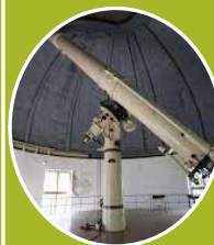
Opservatorija i Planetarijum – obilazak