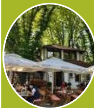
Mali Kalemegdan – okupljanje