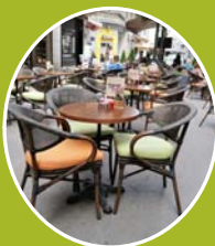
Time cafe – okupljanje