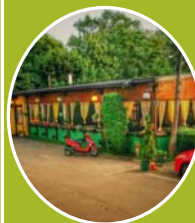
Beogradsko sokače – ručak ili Escape room